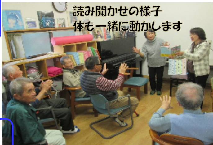
読み聞かせの様子 体も一緒に動かします