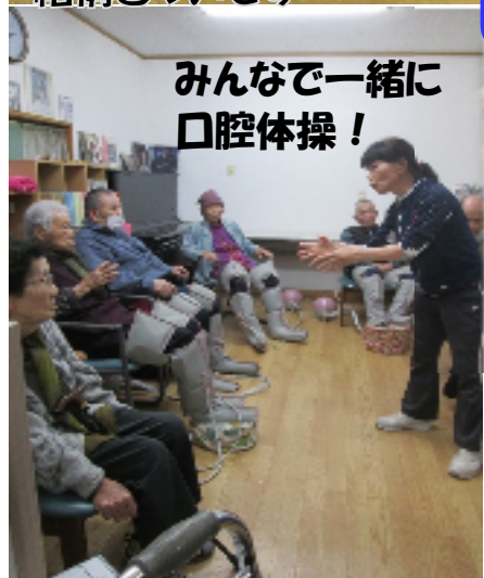
みんなで一緒に 口腔体操！