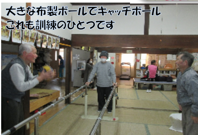
大きな布製ボールでキャッチボール これも訓練のひとつです