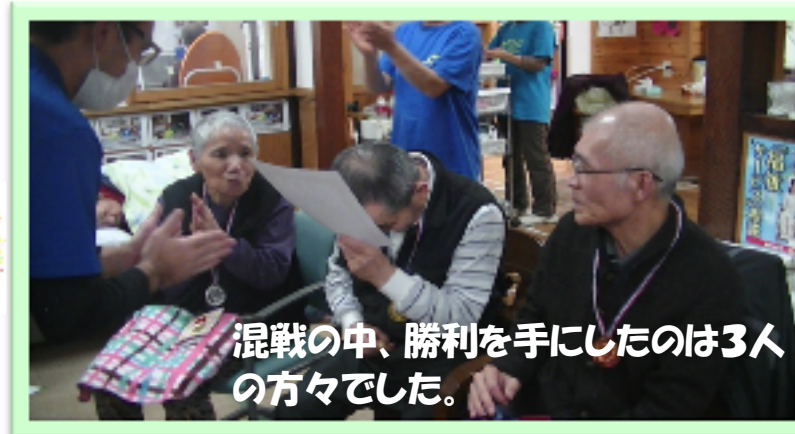
混戦の中、勝利を手にしたのは3人の方々でした。