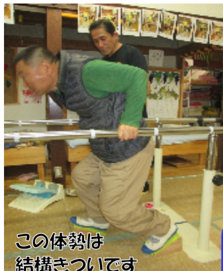
この姿勢は結構きついです