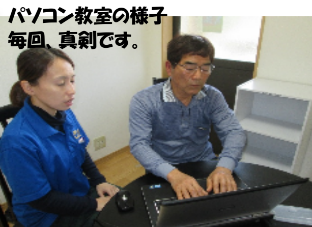
パソコン教室の様子 毎回、真剣です。