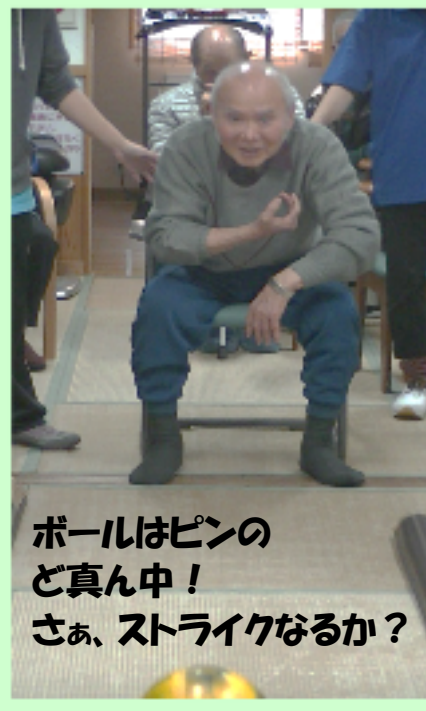
ボールはピンのご真ん中！ さあ、ストライクなるか？