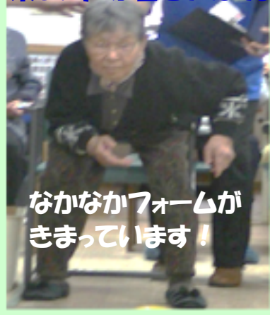
なかなかフォームが きまっています！

ピンめがけてボールを投げる姿は、真剣そのもの！！ ピンを倒した時の嬉しそうな表情、そして賑やかな、 楽しい声が響きわたりました。