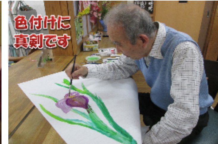
色付けに真剣です