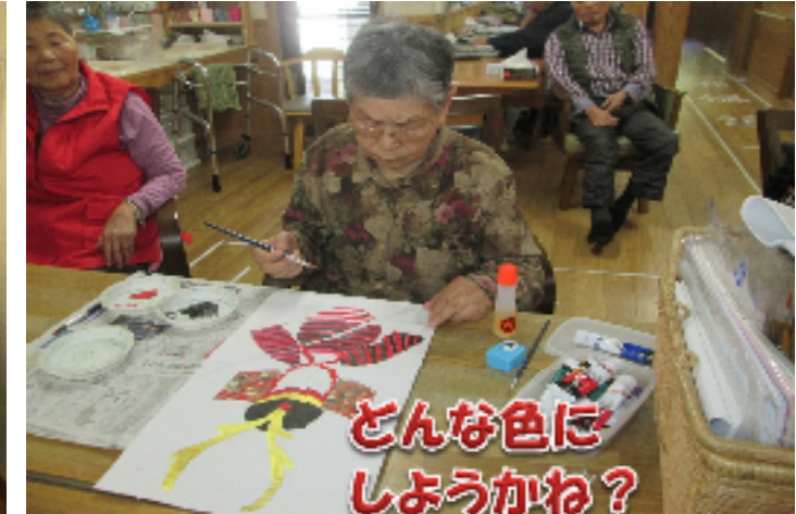
どんな色にしようかね？