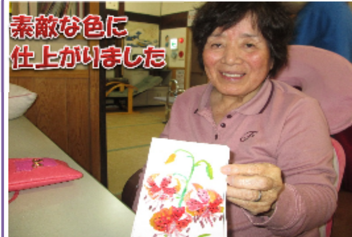
素敵な色に仕上がりました