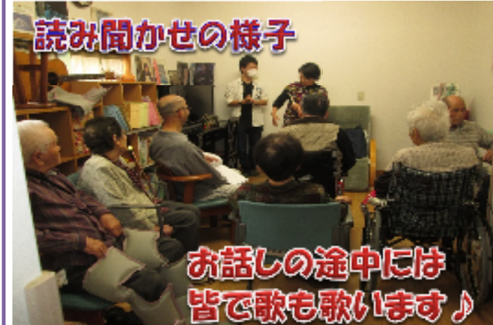
読み聞かせの様子