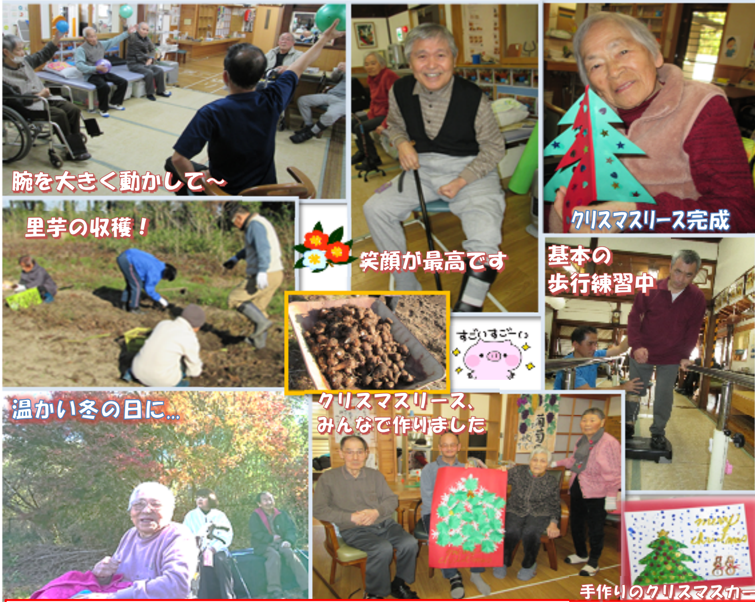
腕を大きく動かして～