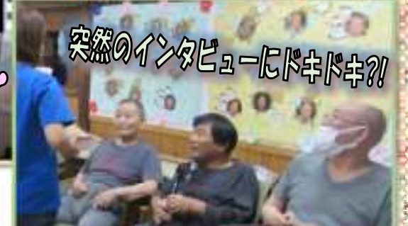
突然のインタビューにドキドキ?!