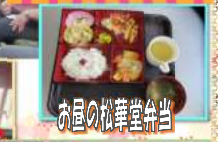
お昼の松華堂弁当