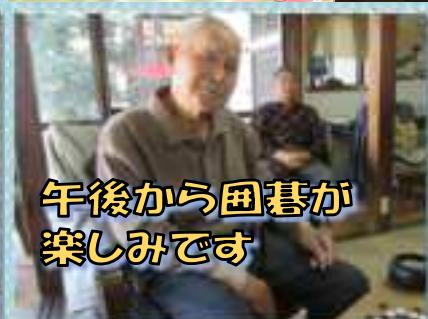
午後から囲碁が 楽しみです