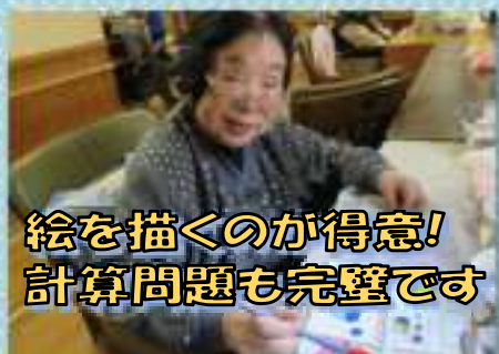
絵を描くのが得意！ 計算問題も完璧です