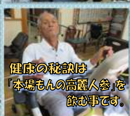
健康の秘訣は 「本場もんの高麗人参」を 飲む事です。