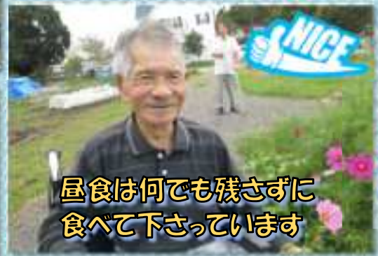
昼食は何でも残さずに 食べて下さっています