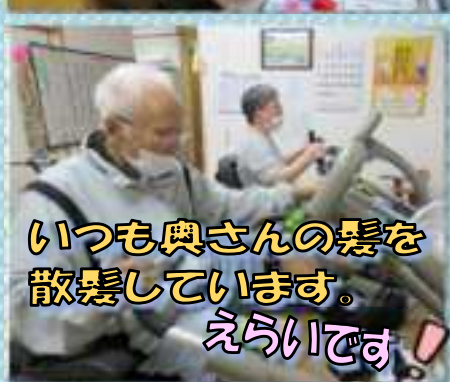
いつも奥さんの髪を 散髪しています。 えらいです!