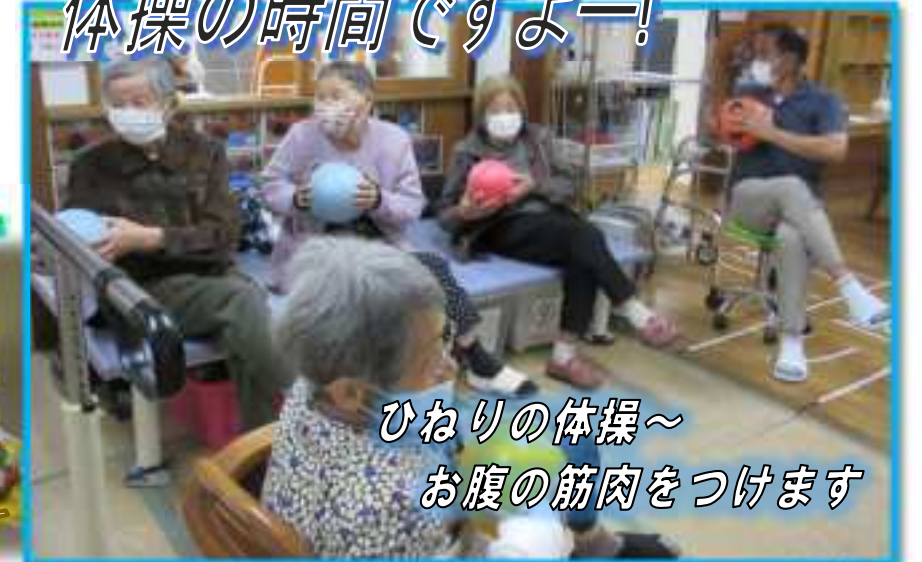
ひねりの体操～ お腹の筋肉をつけます