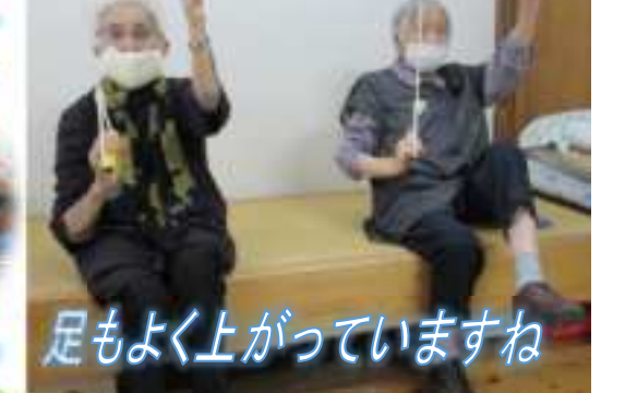
足もよく上がっていますね